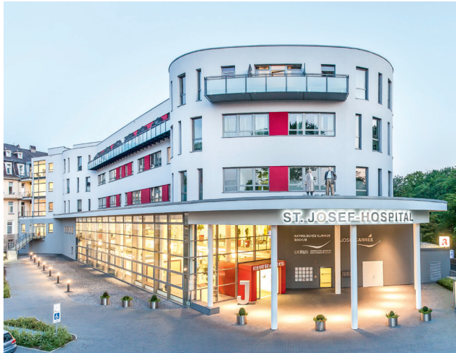
St. Josef-Hospital, Josef Carrée